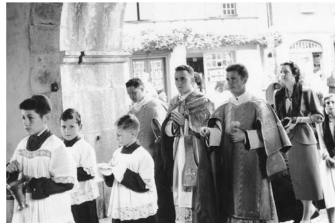
Azkaineko elizan sartzea.