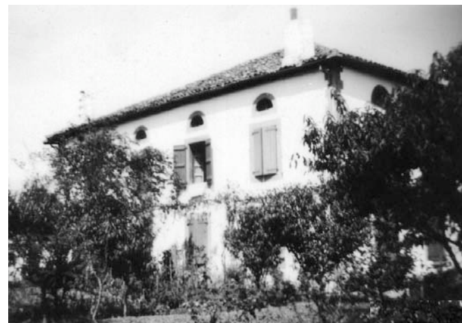
Azkaine-Erribera : sort-etxea