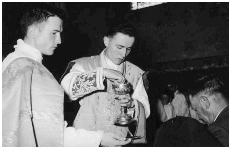
“Har zazue eta jan guziek huntarik”